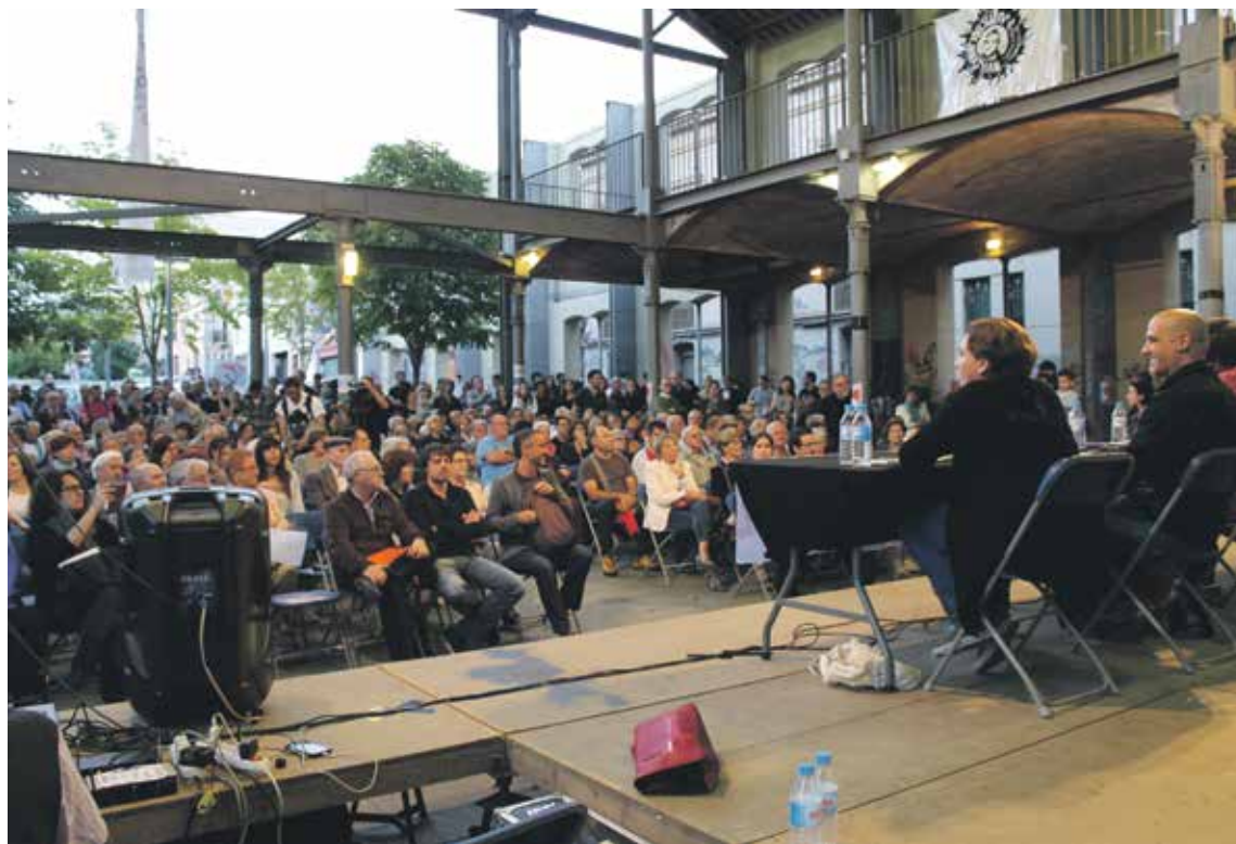
Ada Colau (asseguda a la taula), portaveu de Guanyem Barcelona, va participar a la presentació de Guanyem Terrassa.